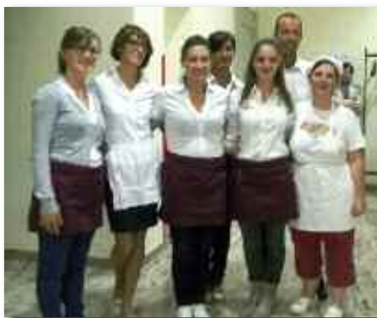
I volontari in cucina