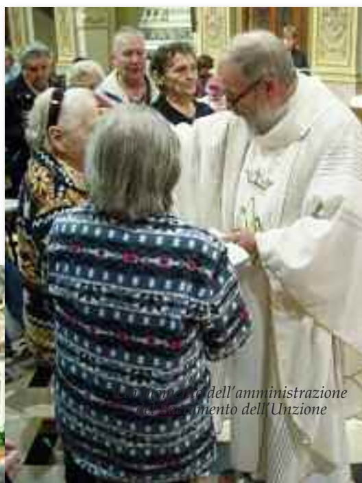
Un momento dell'amministrazione del Sacramento dell'Unzione