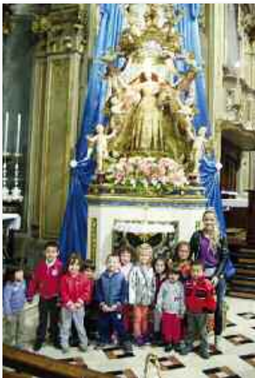
I bambini sotto la statua della Madonna prima di recitare la poesia per i nonni

Fondamento e sintesi di tutto il discorso è la prima beatitudine ("Beati i poveri nello spirito, perché di essi è il regno dei cieli") che non significa tanto: beati quelli che hanno il cuore staccato dalle ricchezze, quanto piuttosto: beati quelli che rinunciano volontariamente alle ricchezze, come ha fatto Gesù che "da ricco si è fatto