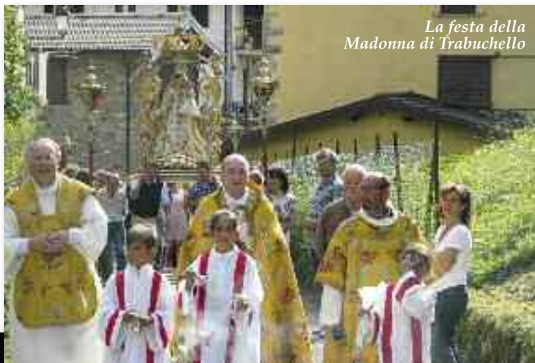
La festa della Madonna di Trabuchello

ne e, poi, ad impastarla con la segatura che, passata di mano in mano, diviene una pallottola tondeggiante da porre sui muri del paese. La suggestione del paese illuminato e profumato è una forma unica per festeggiare la devozione alla Madon-