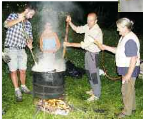
La realizzazione delle Bale de raso

L a festa del SS Nome di Maria a Trabuchello ha come tradizione la realizzazione delle Bale di raso, palle di resina mescolate con segatura che, nella notte della vigilia, riempiono il paese di un profumo affascinante. La realizzazione avviene qualche giorno prima, quando, piccoli e grandi, si ritrovano a far sciogliere la resina raccolta durante l'estate nel grande pentolo-