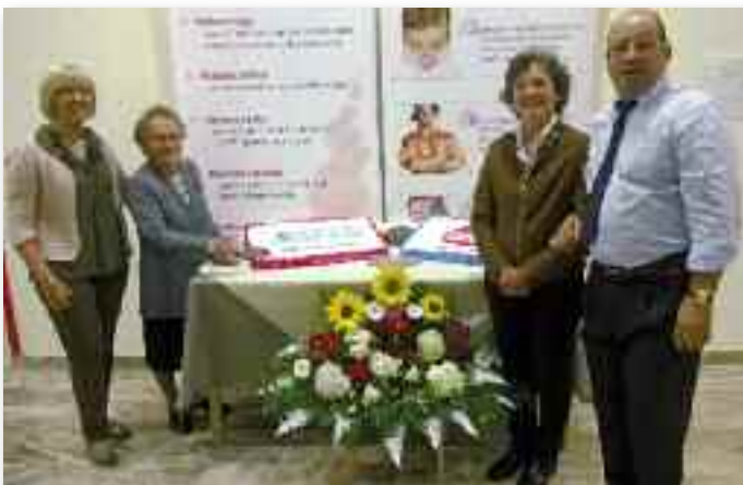
Gli organizzatori della festa