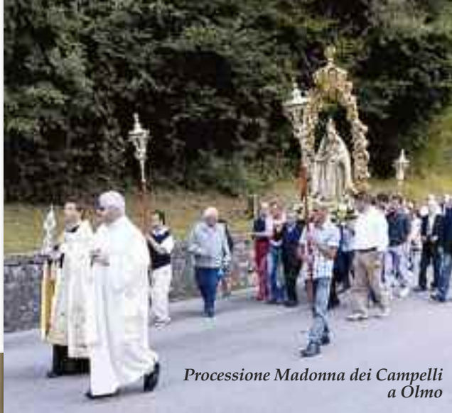
Processione Madonna dei Campelli a Olmo

uattro momenti diversi, quattro occasioni differenti, ma un unico obiettivo, salutare e ringraziare colui che per diversi anni ci ha guidati e cresciuti nella fede di quel Dio che tutti ci accomuna.