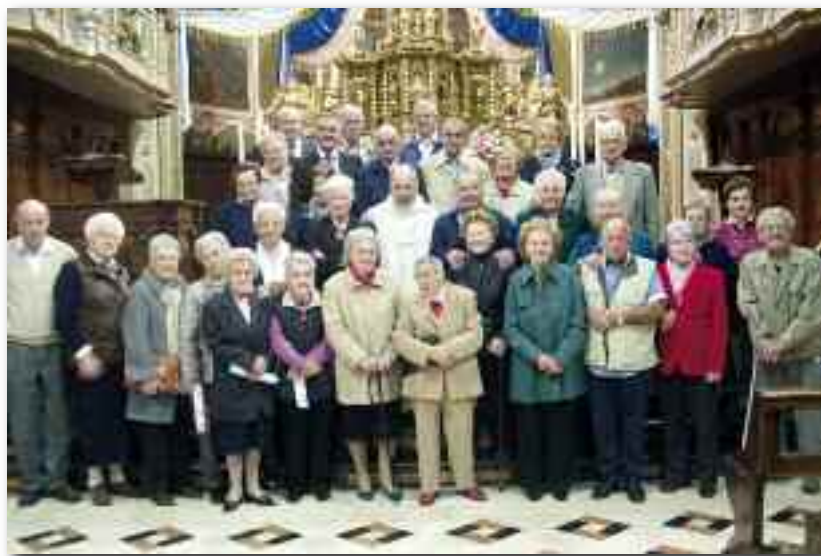
Un gruppo di anziani posa dopo la S. Messa

povero", e vivono una vita sobria affinché quanti nella società sono stati meno favoriti o più umiliati possano vivere una vi-