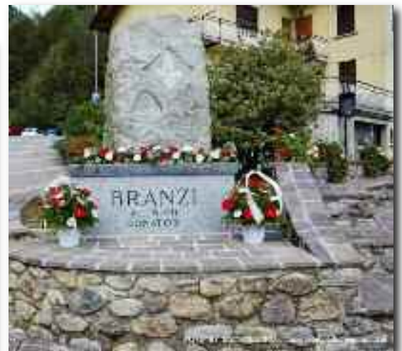
Monumento del Donatore