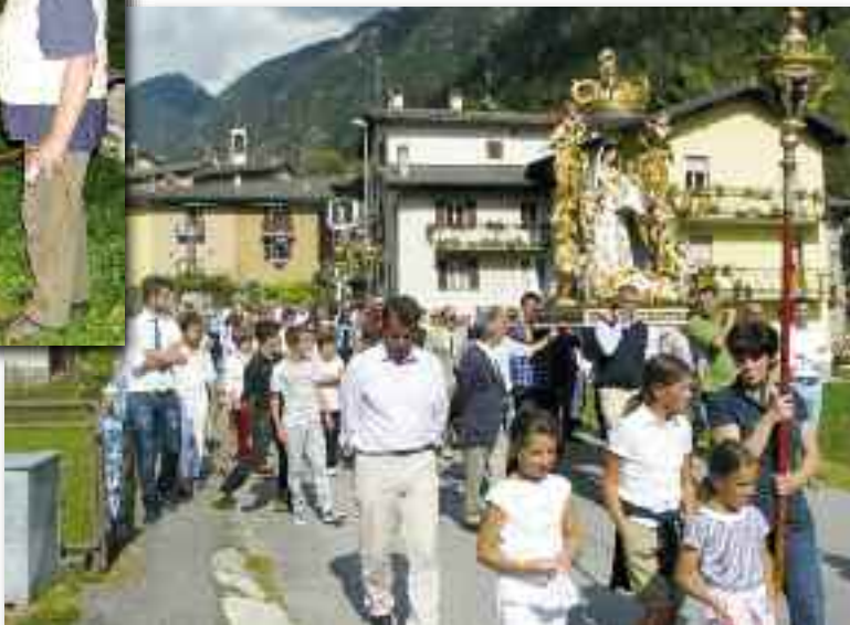
Processione della festa della Madonna a Trabuchello

na che continua a vivere grazie alla volontà di alcuni papà e nonni pronti a trasmettere a figli e nipoti questa bella tradizione.