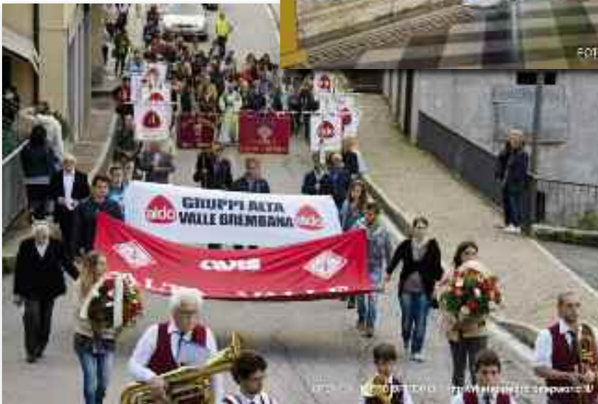
Corteo per il paese