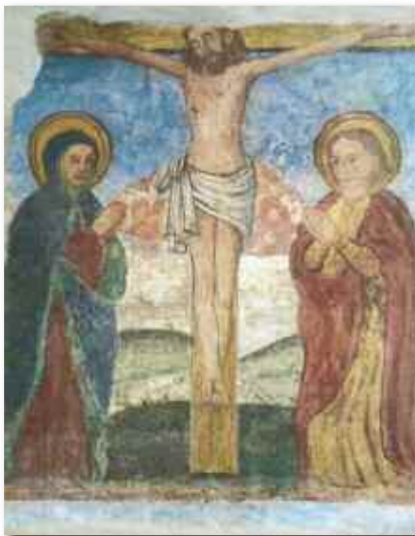
Affresco ritrovato in via centro, inaugurazione 6 settembre 2014

La numerosa discendenza dei Baschenis (18 affrescatori e un pittore, Evaristo) si distinse per l'impronta marcatamente popolare e caratterizzata da una funzione didascalica, comprensibile anche ai loro committenti devoti, a quel quasi tutti analfabeti.