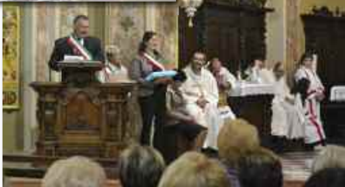
I rappresentanti delle quattro comunità civili