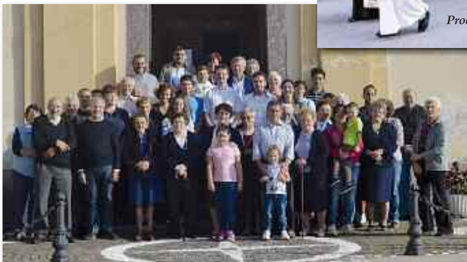
Don Giovanni con la comunità di Piazzolo

Ti ringraziamo per la devozione, la preparazione ed il riserbo che hai mostrato nel condividere con tutti noi il tuo cammino di fede e di amore verso Dio e il prossimo.