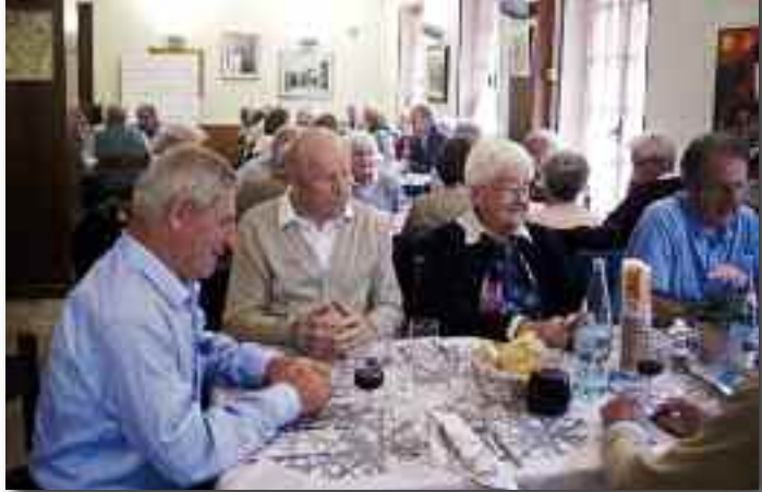
Un momento del pranzo