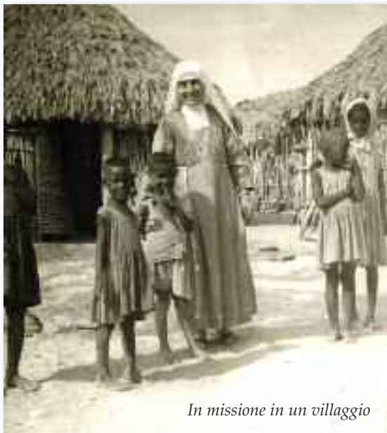
In missione in un villaggio