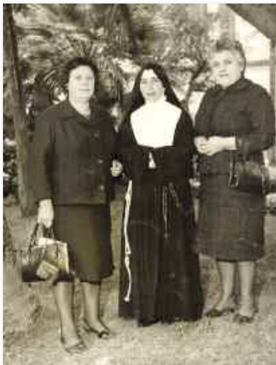
Il giorno della professione con le due sorelle