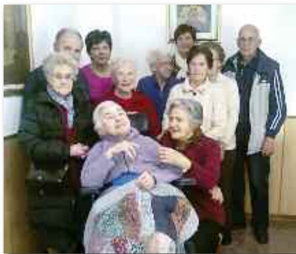
Nell'ultima fase della sua vita terrena