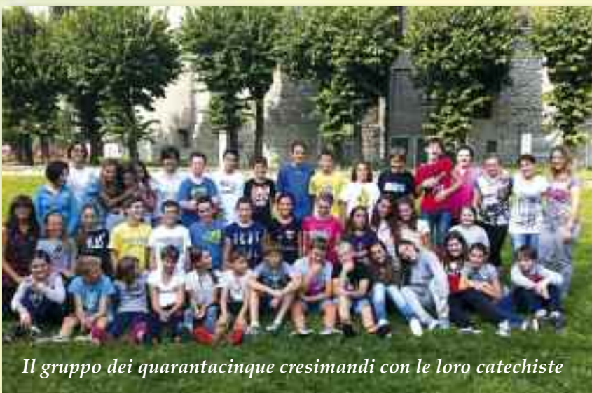
Il gruppo dei quarantacinque cresimandi con le loro catechiste

Il gruppo dei cresimandi che con il curato sono