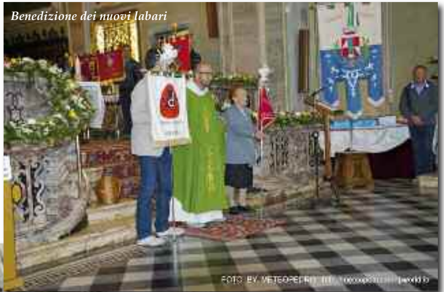
Benedizione dei nuovi labari