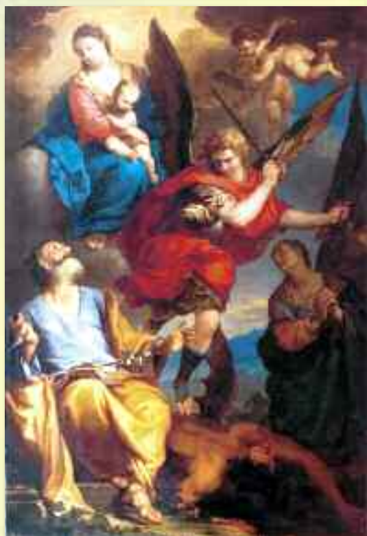
VALNEGRA - CHIESA DI S. MICHELE

L' Arcangelo S. Michele era già considerato dagli Ebrei come il Principe degli Angeli, protettore del popolo eletto, simbolo della potente assistenza divina su Israele. Nell'Antico Testamento è nominato tre volte nel libro di Daniele e il suo nome Mi-Ka-El, significa "chi come Dio?", a ricordare la cacciata dal Paradiso dei diavoli ribelli, con a capo Lucifero. A S. Michele è attribuito il titolo di Arcangelo così come Gabriele -forza di Dio- e Raffaele -Dio ha curato-. Nel Nuovo Testamento S. Michele è rappresentato come l'avversario del demonio e vincitore dell'ultima battaglia contro Lucifero e i suoi seguaci. Per i cristiani quindi S. Michele è considerato il più potente difensore del popolo di Dio. Nell'iconografia, sia orientale che occidentale, è rappresentato come un combattente con la spada o la lancia in mano con sotto i suoi piedi il drago o satana sconfitto. San Giorgio fu una riedizione orientale, portata in occidente dai crociati, di S. Michele. Da secoli i credenti si affidano alla sua protezione qui sulla terra, ma specialmente nel momento del grande Giudizio di Dio. Per questo L'Arcangelo viene riconosciuto anche come guida delle anime al cielo e la tradizione attribuisce a S. Michele il compito della pesatura delle anime dopo la morte. Per questo in molte sue rappresentazioni icono-