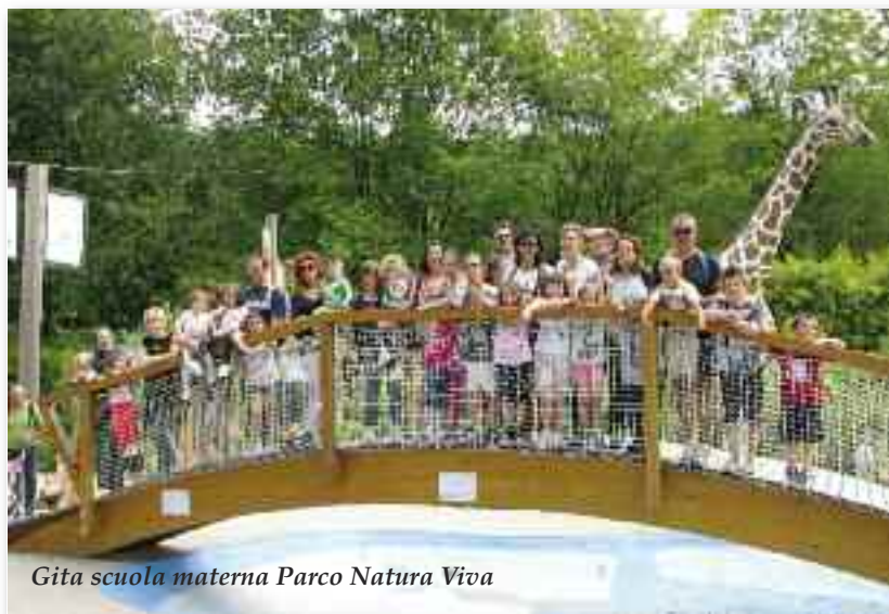
Gita scuola materna Parco Natura Viva

scuola sostegno imprescindibile, insegnati che assumono la responsabilità della cura e della dedizione. Si riannodano i legami che hanno permesso ai bambini di credere nel domani perché il presente è pieno di segni belli e positivi, e ai grandi di sperare che il presente è ancora abitato da persone pronte ad aiutare e il domani è ricco di opportunità di aiuto reciproco. Relazioni che gli esperti chiamano rete educativa, legami che non lasciano cadere i piccoli e i fragili nelle trappole della vita.