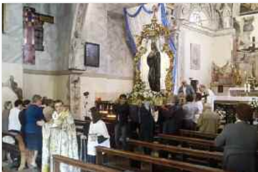
Festa della Madonna Addolorata 21 settembre 2014

invitati tutti i ragazzi (elementari e medie) con i genitori e celebrazione del mandato ai catechisti e operatori pastorali, sotto lo sguardo della Madonna del Rosario, venerata in tutte le nostre 3 Parrocchie da splendido altare, con i Misteri appunto del Rosario.