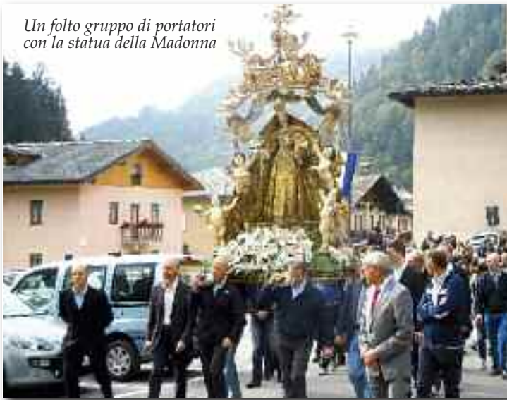
Un folto gruppo di portatori con la statua della Madonna

tirci amati e sostenuti nel cammino della vita.