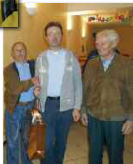
Don Giovanni al suo ingresso a Gorlago

Caro don Giovanni ti chiediamo di conservare nel tuo cuore i ricordi più belli di questi anni trascorsi con noi e di ricordarci nelle tue preghiere.