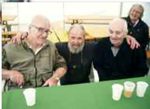
Alcuni ospiti del don Palla fanno merenda

Usciti dalla chiesa abbiamo trovato un'accogliete tensostruttura, allestita a tempo record da un gruppo di volontari del paese, che ci ha permesso di consumare comodamente un po' di merenda prima che gli amici del