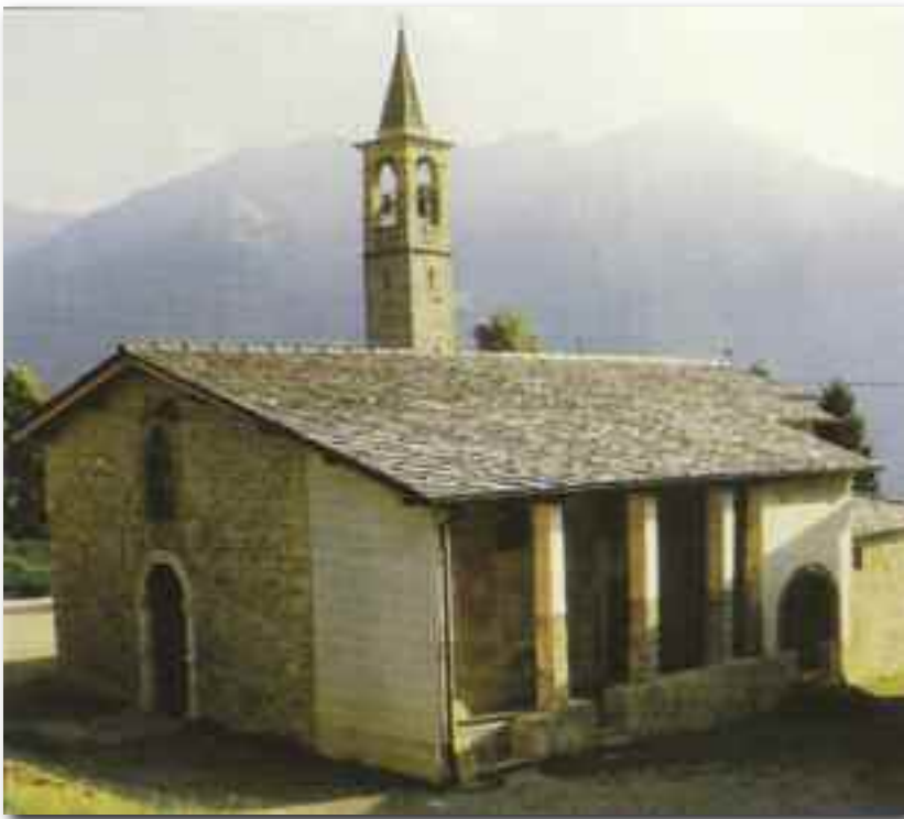
Chiesa antica di Santa Brigida, consacrata nel 1468, visitata dagli arcivescovi di Milano (S. Carlo 20 ottobre 1566) matrice delle parrocchie di Cusio, Ornica, Mezzoldo, Averara, Cassiglio